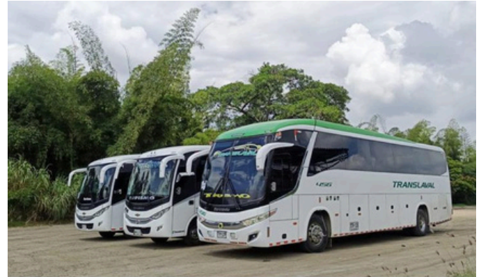
Del 18 al 31 de agosto, cada trayecto se recorre con Translaval

Finalmente, como parte del fortalecimiento institucional y estratégico de la organización, en el mes de agosto se dio inicio al proceso de registro de marca ante la Superintendencia de Industria y Comercio, reafirmando el compromiso de Translaval con la consolidación de su identidad corporativa y la protección de sus activos intangibles.